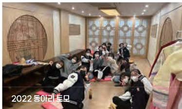
2022 동아리 토모