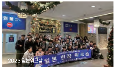
2023 일본워크숍 일본 현장 워크숍